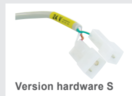
Version hardware S

Tout risque éventuel de pincement est réduit, car les moteurs sont programmés pour s'arrêter et s'inverser, s'ils rencontrent une quelconque résistance lors de leur fermeture. Le point de consigne fixé quand le moteur s'inverse peut être programmé individuellement pour chaque moteur.