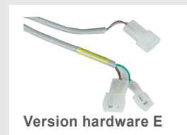
Version hardware E