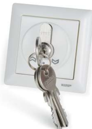
WSA 210 1161