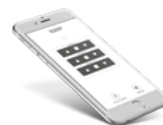
Fresh Air Control - application