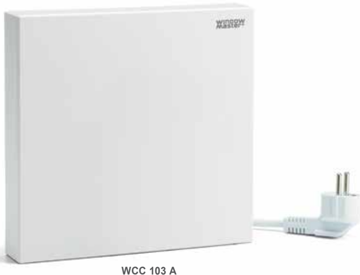
WCC 103 A