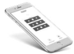
Fresh Air Control - app