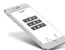
Fresh Air Control - app